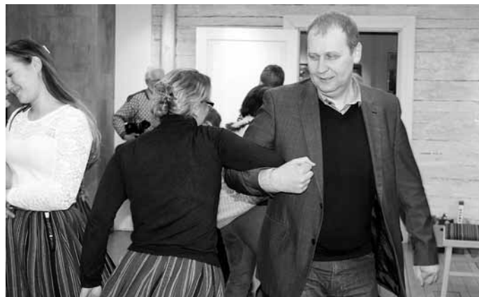
Maaeluminister Urmas Kruuse tantsusamm Kihnu muuseumis oli hoogne ning suvel lubas ta Kihnu tagasi tulla.

Maaeluministrile meeldis ka kohtumine rahvaga, mis oli muhe ja vahetu, sest inimesed julgusid küsida ja