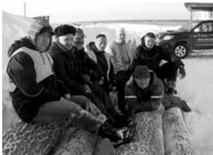
Laeva puud koos talgulistega Munalaiu sadamas.

See mootor koos muude tollest ajast jäänud asjadega jäävad jõujaama ekspositsiooniks - nii on ka edaspidi võimalik näha, kuidas vanasti saarel elektrit toodeti.