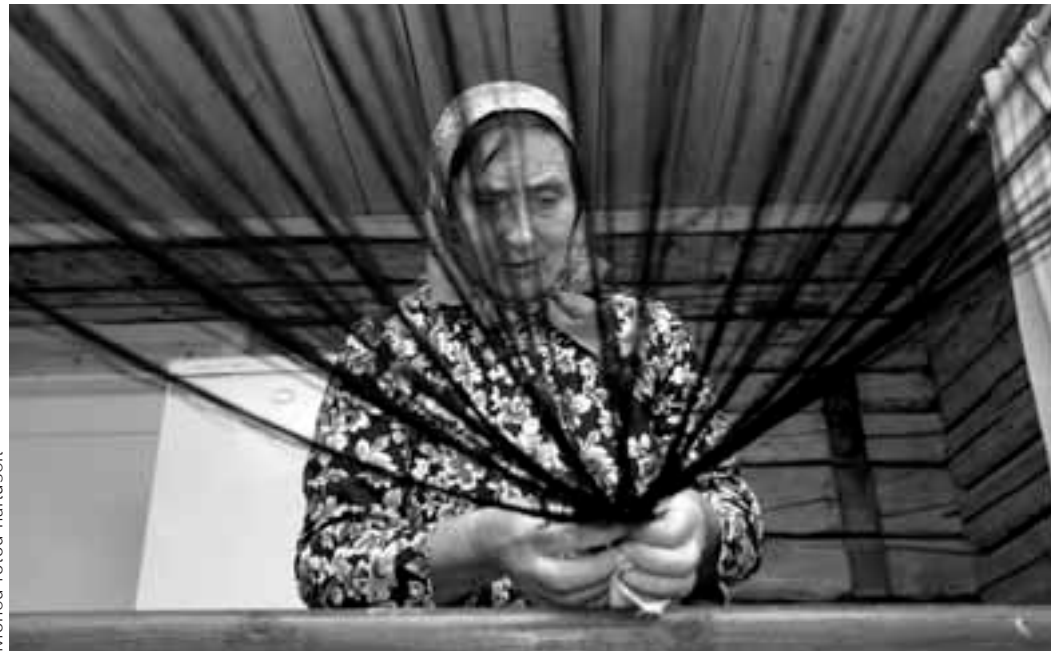
Mõned fotod näitusest