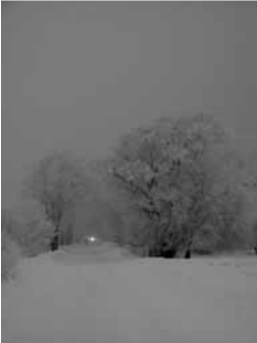
"Kaja-Kualu tie, Uadu kohtõs" (elukeskkond), foto: Hedy Põlluste