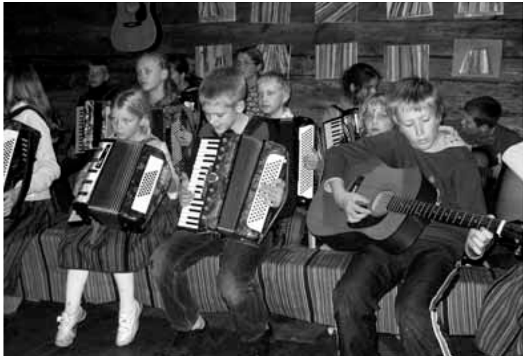
&lt;&lt;Algus lk 6

Eesti Apostlik-Õigeusu Kirik on otsustanud sõlmida alates 2010. aastast kogu kirikumaa kasutamiseks pikaajalise lepingu kohaliku põllumajandusettevõttega.