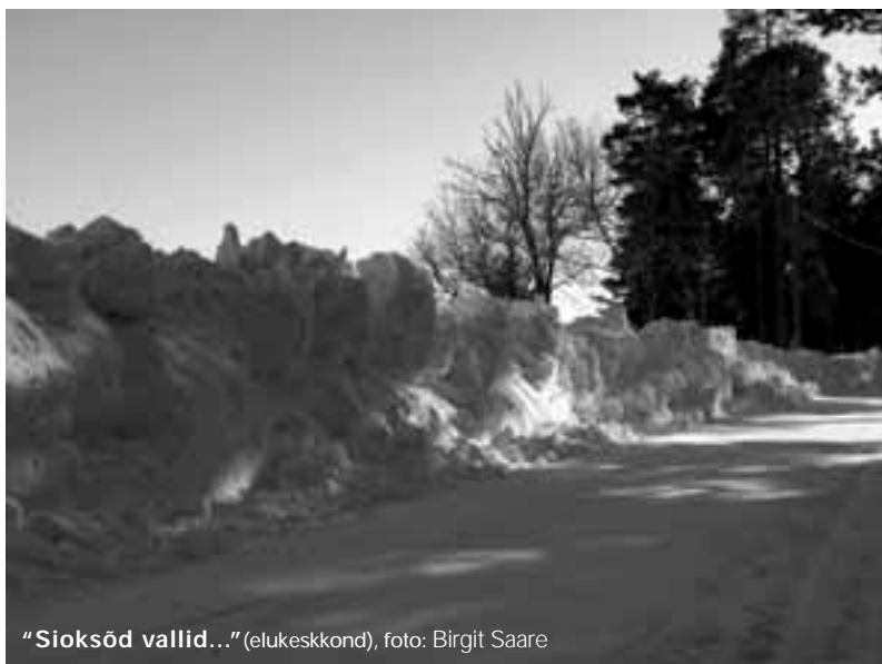
"Sioksõd vallid..." (elukeskkond), foto: Birgit Saare