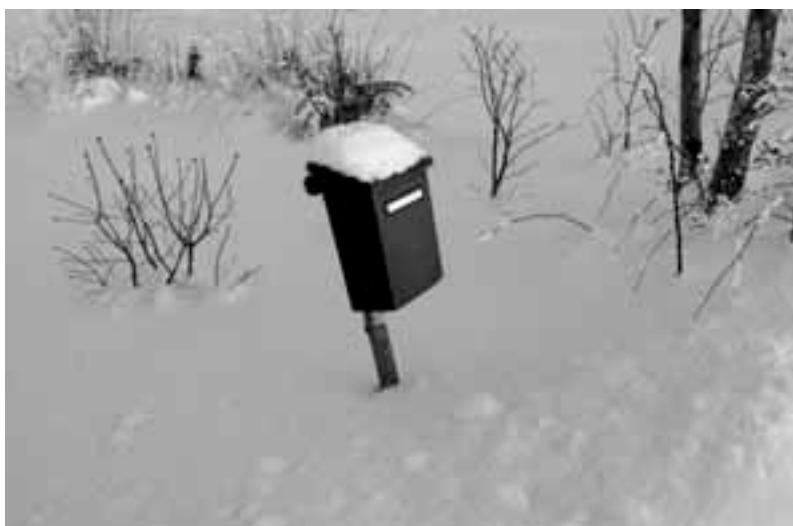
"Postkast" (üksikobjektid), foto: Anu Semjonova