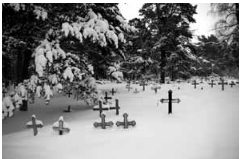
"Surnuaid" (üksikobjektid)