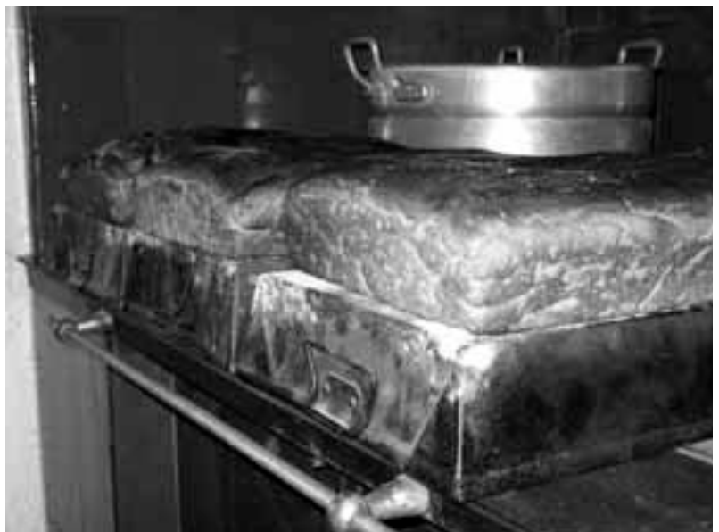
"Rugileväd" (tegevus), foto: Alvar Umb