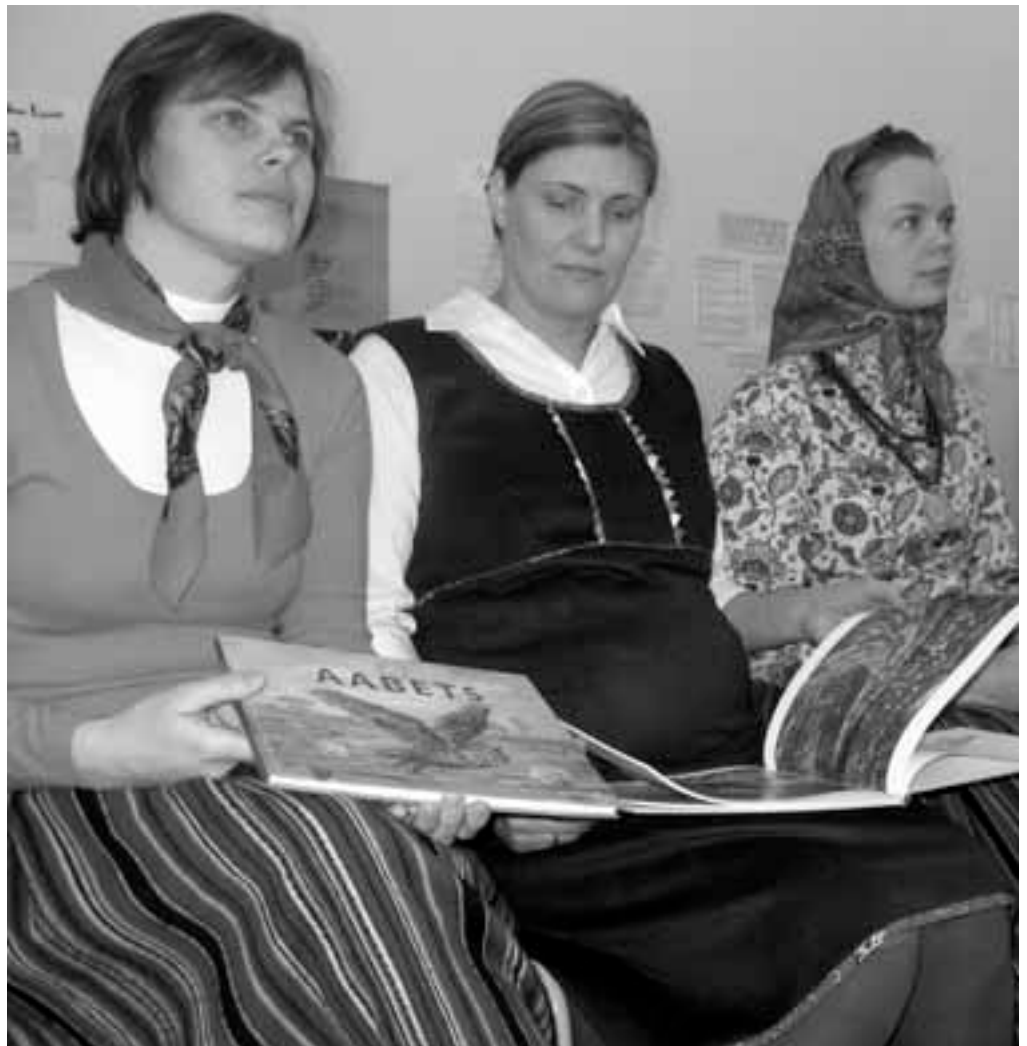
„Aabetsa“ tekstid on autorite- Evi, Külli ja Reena – omalooming. Foto raamatu esitlusest