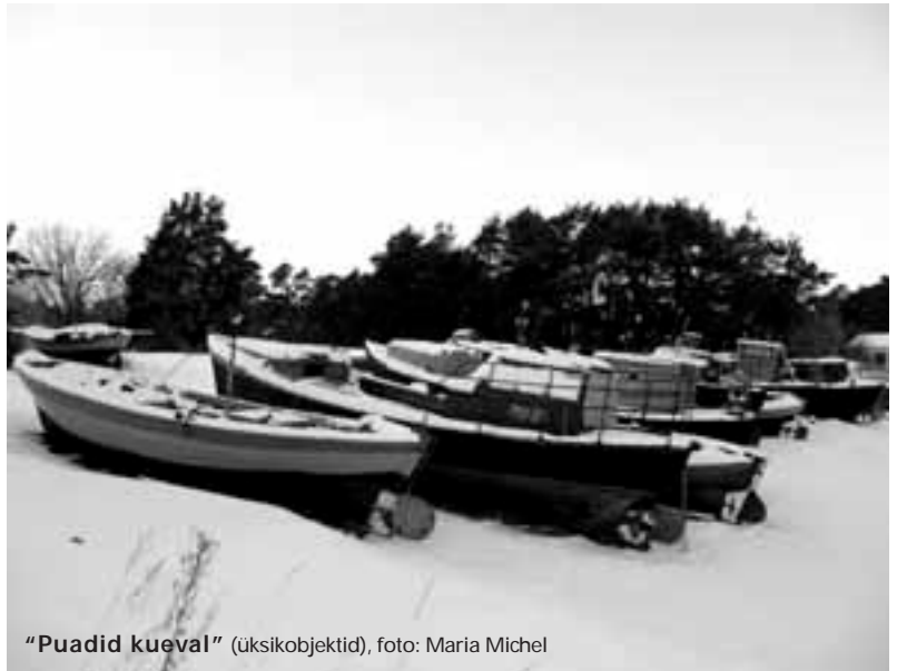
"Puadid kueval" (üksikobjektid)