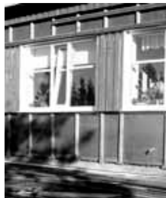
Remondiga loodetakse koolimaja talvel soojemaks saada.

Samuti ei ole hoones piisavalt ruumi lasteaiade jaoks - kui siiani mahutati lasteaiaruumidesse 18 last, siis pärast tervisekaitse külastusele järgnenud päringut tohib lasteaiade võtta 15 last ja sü-