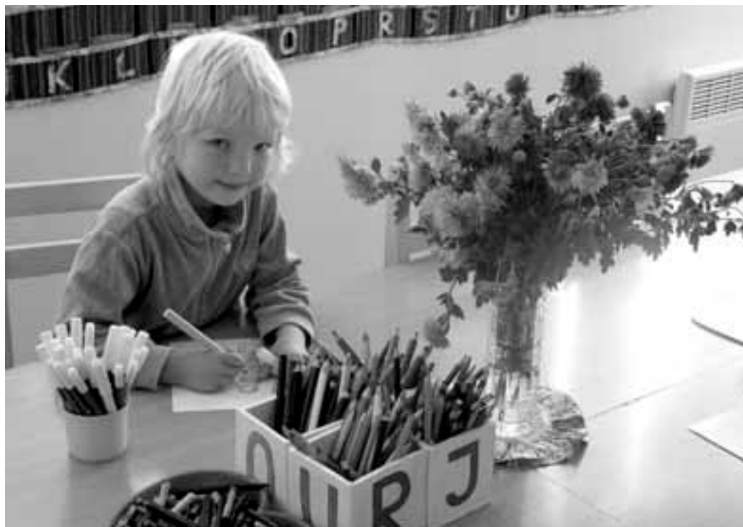
Vallavanema hinnangul on Kihnus head kasvatajad ja sellepärast on lasteaed populaarne.

Tänu maksulaekumisele ehk teisisõnu, tänu kihnlaste töö-