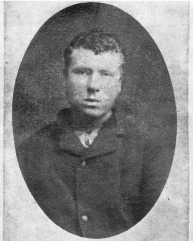
Jaan Umb.

„6. oktoobri öösel 1887. aastal märgati Bornholmi saare lähedal laeva häda-signaaliga mastis. See oli kolmemastiline kuunar „Johannes“. Laeva pardal ul-