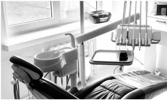
Hambaravikabinetti on kihnlased pikisilmi oodanud ja nüüd saab see teoks.

Metsamaa pärismuskeskuse ehitustööde jätkumine - jätkuvad ehitustööd keskuse väljaehitamiseks Eestvedaja on SA Kihnu Kultuuriruum. Valla 2012. a eelarve eelnõus on toetusmaht 2350 eurot LEADER toetuse omafinantseeringu katmiseks.