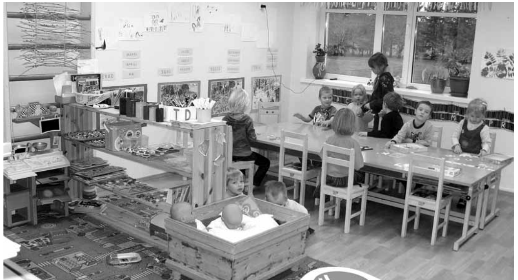
Lasteaiaaeglaste mudilasi on Kihnus nii palju, et lasteada laiendati, kuid ikka oleks ruumi juurde vaja.

Muidugi on kerkinud üles ka poliitilisi probleemitõsta-