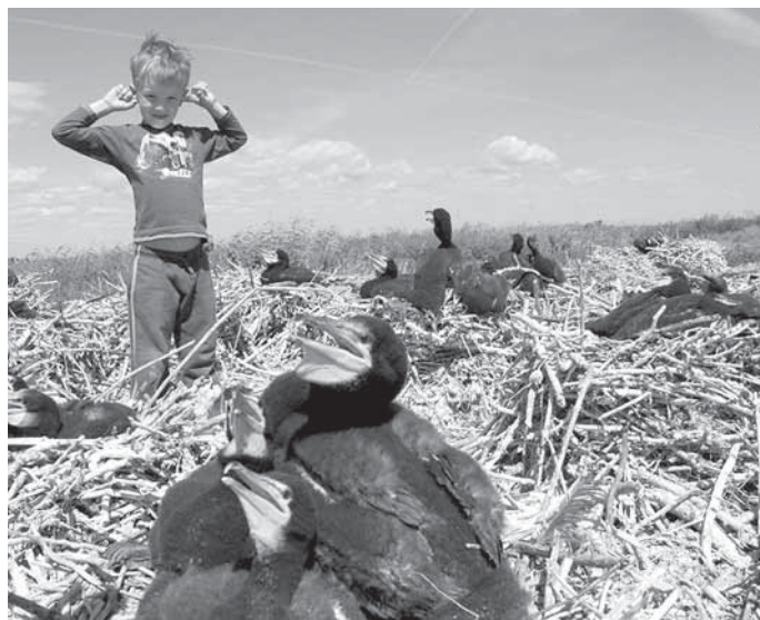
Kormonautide kisa teeb Rasmuse päris kurdiks!