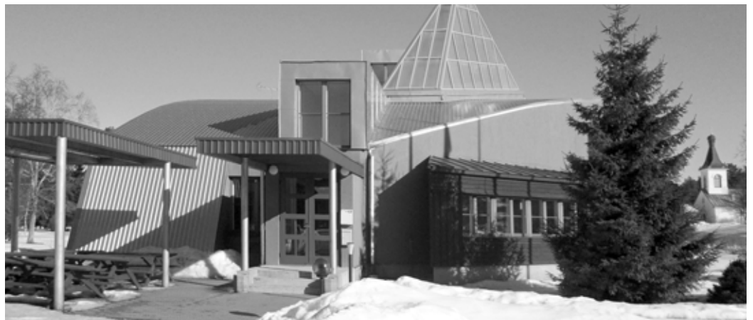
Rahvamaja paigaldatakse maaküte, et elektrikulud oleksid väiksemad.

Tänaseks on sisuliselt valmis Uusmaja korter 8/2 ehk siis üks ühetoaline korter, mis eelmisel aastal jäi pooleli. Mäletatavasti ehitati see kolmetoaline korter, kus oli vanasti hoiukassa ümber