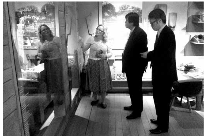
Jaapani külalisi huvitas nii Kihnu olevik kui tulevik.

Lisaks tutvustati suursaadikule erinevaid arendus-